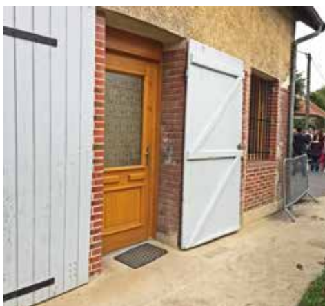
Ecole Cote 204

Le bureau du directeur et la nouvelle cantine (à droite)