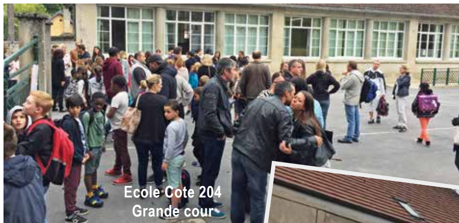
Ecole Cote 204 Grande cour