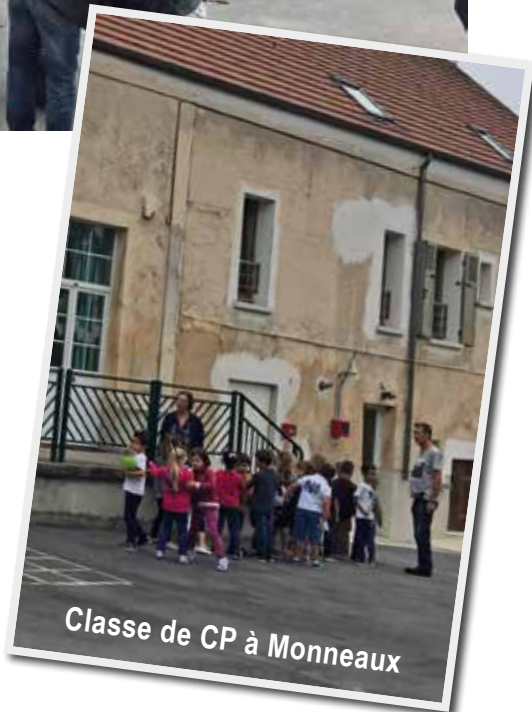
Classe de CP à Monneaux