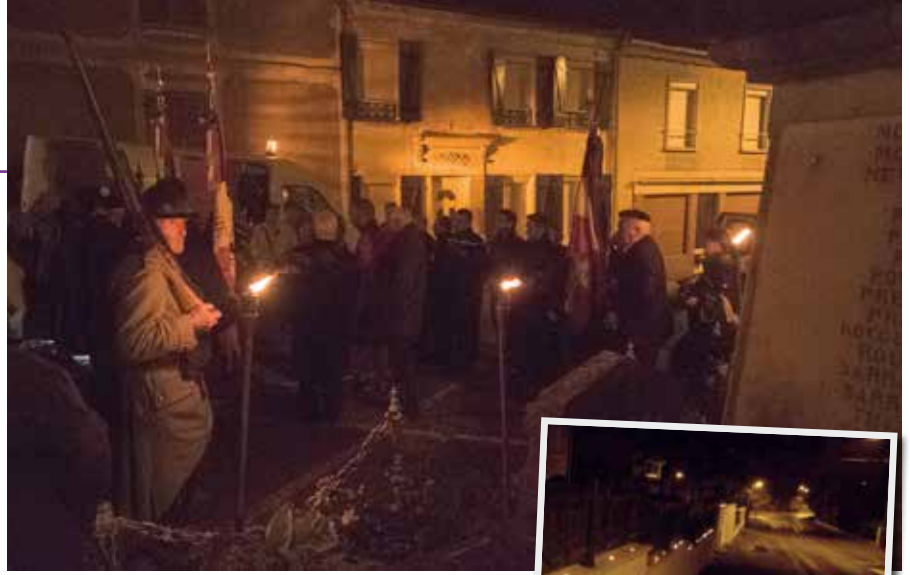
◀ Pendant les cérémonies la rue Churchill est neutralisée et déviée rue de l'abbaye.