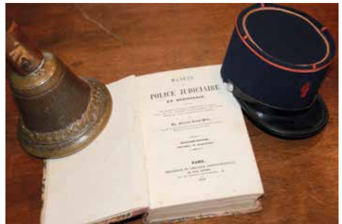
▲ Autre livre de référence, qui se trouve dans les archives de la mairie... Manuel de Police Judiciaire et Municipale. Mais attention celui-ci n'a pas servi depuis longtemps car publié en 1856!