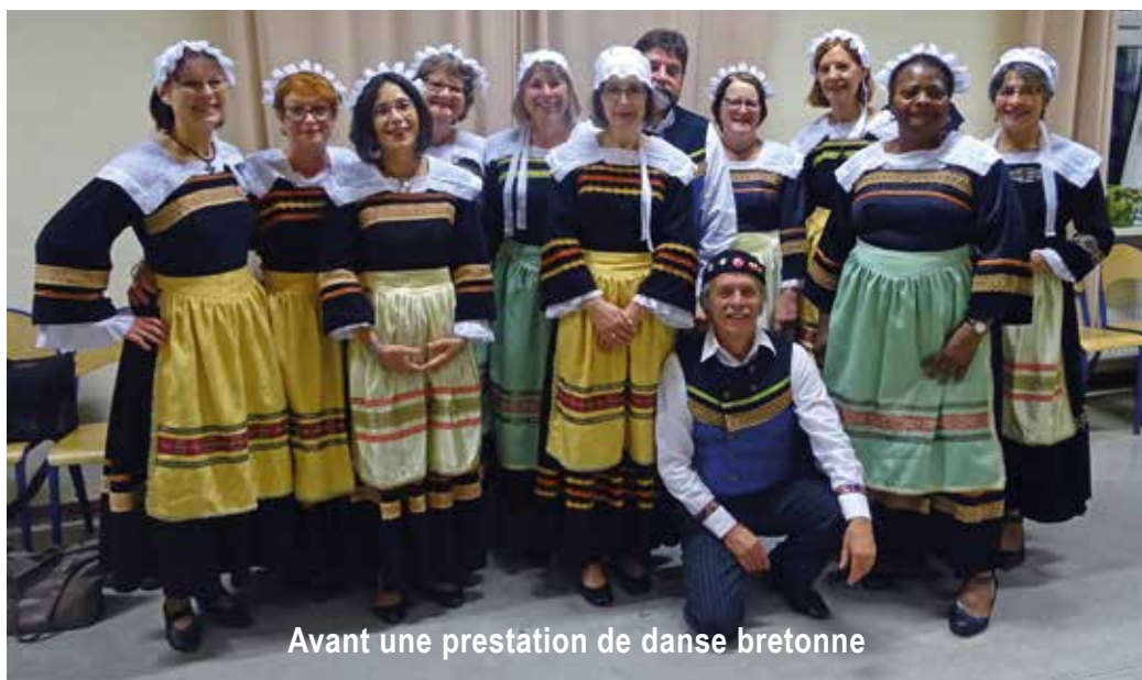
Avant une prestation de danse bretonne

Une journée de danse et musique folk sera également organisée le 10 mars 2018, salle polyvalente place du Cygne. A cette occasion, un stage de danses du Poitou aura lieu le samedi après-midi, et un bal le samedi soir dès 20h30. Restauration sur place.