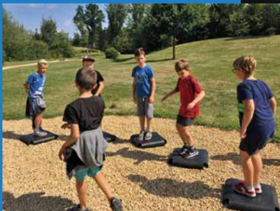
Activités de Loisirs en juillet 2017