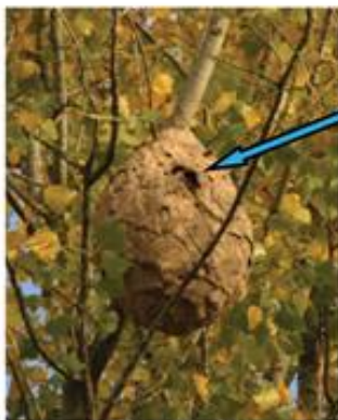
Trou d'entrée du nid sur le côté