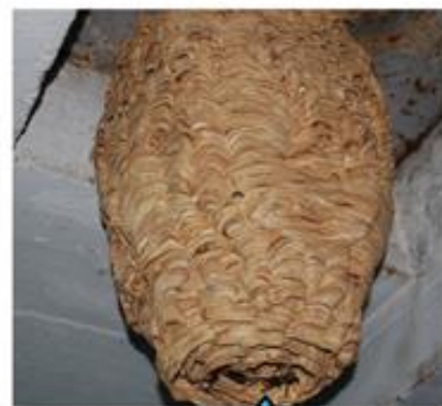
Trou d'entrée du nid au dessous

Pour chacun d'entre nous, cela passe par une visite régulière et minutieuse, dès le printemps, des abris, réserves à bois, serres, angles de fenêtre, niches, poulaillers, cartons entrouverts, tonneaux, buissons, regards d'eau pluvial... afin de détecter le plus précocement possible les nids et engager leur destruction.